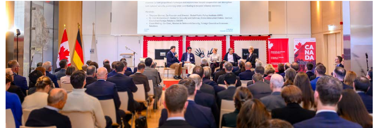
Die Konferenz FORUM@KANADA HAUS 2025 in der kanadischen Botschaft in Berlin

Am Anfang stand eine Win-Win-Konstellation: Im Vorstand der DKG suchte man nach einem geeigneten Veranstaltungsformat für die sogenannten Young Professionals. Die Kanadische Botschaft in Berlin suchte nach Möglichkeiten, ihren Wirkungsradius in Berlin zu erweitern.