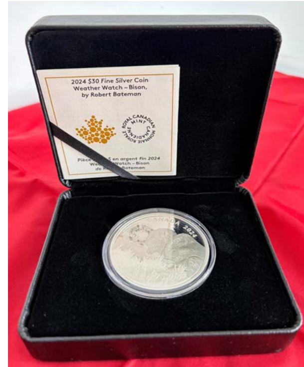
Münze und Urkunde des DKG Ehrenpreises