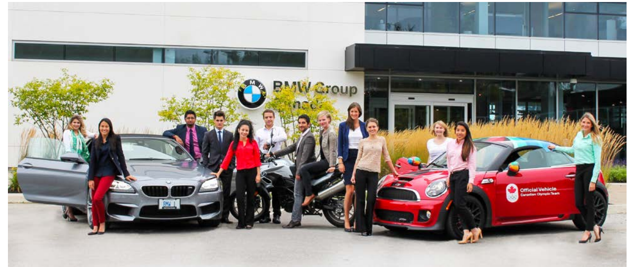
Interns vor dem Gebäude von BMW Canada