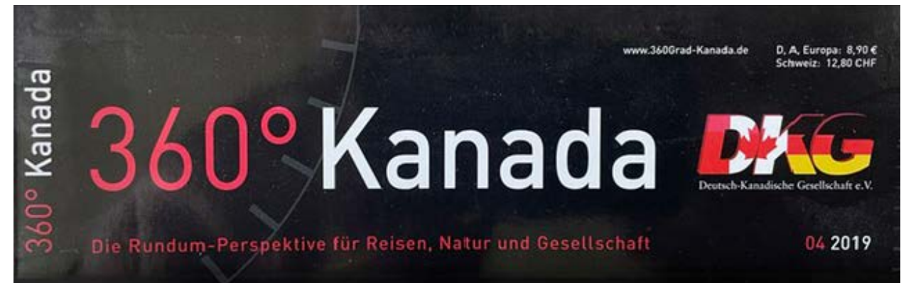
Kommunikativer Auftritt des DKG Journals als eigenständiges Heft (bis 2013) und als Teil des Magazins 360 grad Kanada