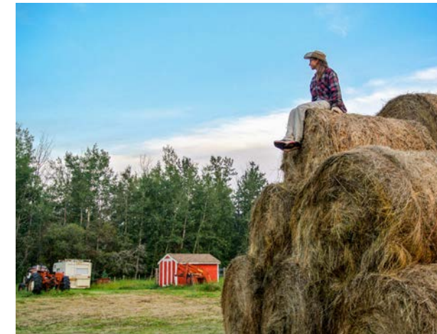
Arbeiten auf der Farm

Über die Jahre hat sich das Gesicht des Programms gewandelt, aber der Kern blieb stabil. Die Partnerschaft mit der kanadischen Regierung und die enge Zusammenarbeit mit Arbeitgebern vor Ort machten das WSP zu einem Qualitätssiegel. Es ging nie um „Urlaub mit Gelegenheitsjobs“, sondern um die Integration in den kanadischen Arbeitsmarkt und Lebenswirklichkeit.