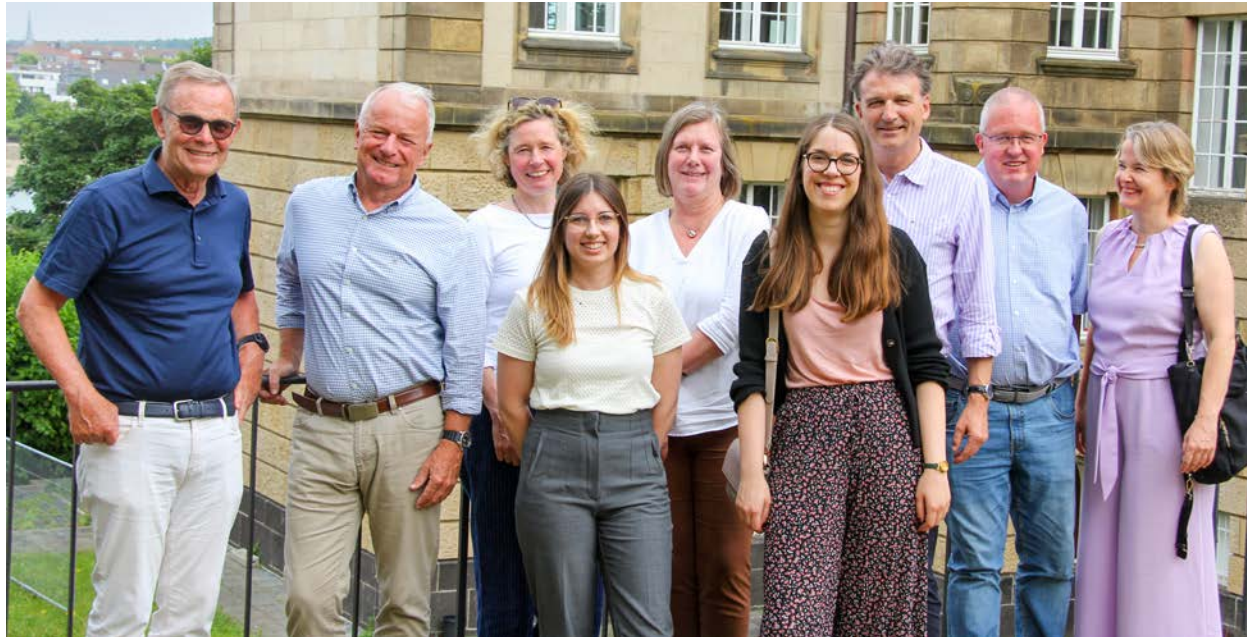
Die Regionalleiter der DKG beim Jahrestreffen 2025 in Bonn

(gs) Der Ursprung der Regionalgruppen liegt in den frühen 1970er Jahren. Die Teilnehmer der ersten Jahrgänge des Werkstudierendenprogramms (WSP) kamen voller Begeisterung und mit dem „Kana-davirus“ infiziert nach Deutschland zurück. Die Deutsch-Kanadische Gesellschaft hatte ihnen eine damals außergewöhnliche Erfahrung ermöglicht.