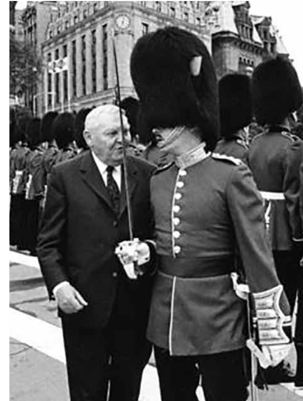
Bundeskanzler Ludwig Erhard bei seinem Staatsbesuch im Juni 1964 in Ottawa