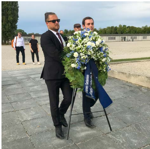
Kranzniederlegung im KZ Dachau

Jeder Studienreise liegen drei zentrale Fragen zugrunde: typischerweise je eine mit wirtschaftlichem, politischem und gesellschaftlichem Fokus. Seit 2019 besuchten Teilnehmende fünf kanadische Provinzen und fünf deutsche Bundesländer. Mit der im Herbst bevorstehenden YTL26-Tour kommt mit Nordrhein-Westfalen das sechste Bundesland hinzu. Bisher haben wir mehr als 130 offizielle Termine absolviert und sind mit weit mehr als 250 Personen ins Gespräch gekommen.