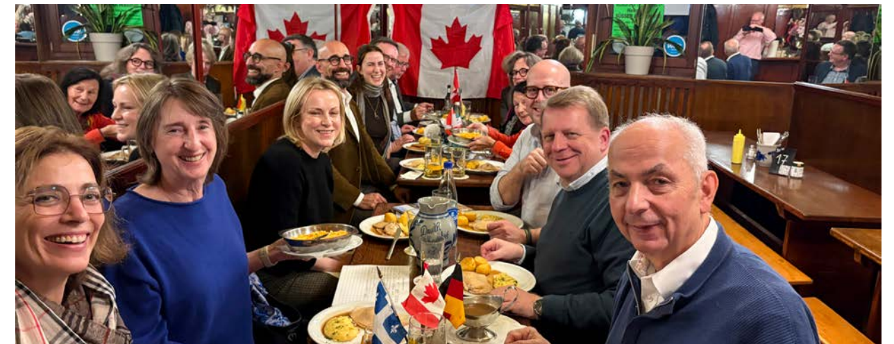
Die Regionalgruppe Rhein/Main beim Thanksgiving Dinner