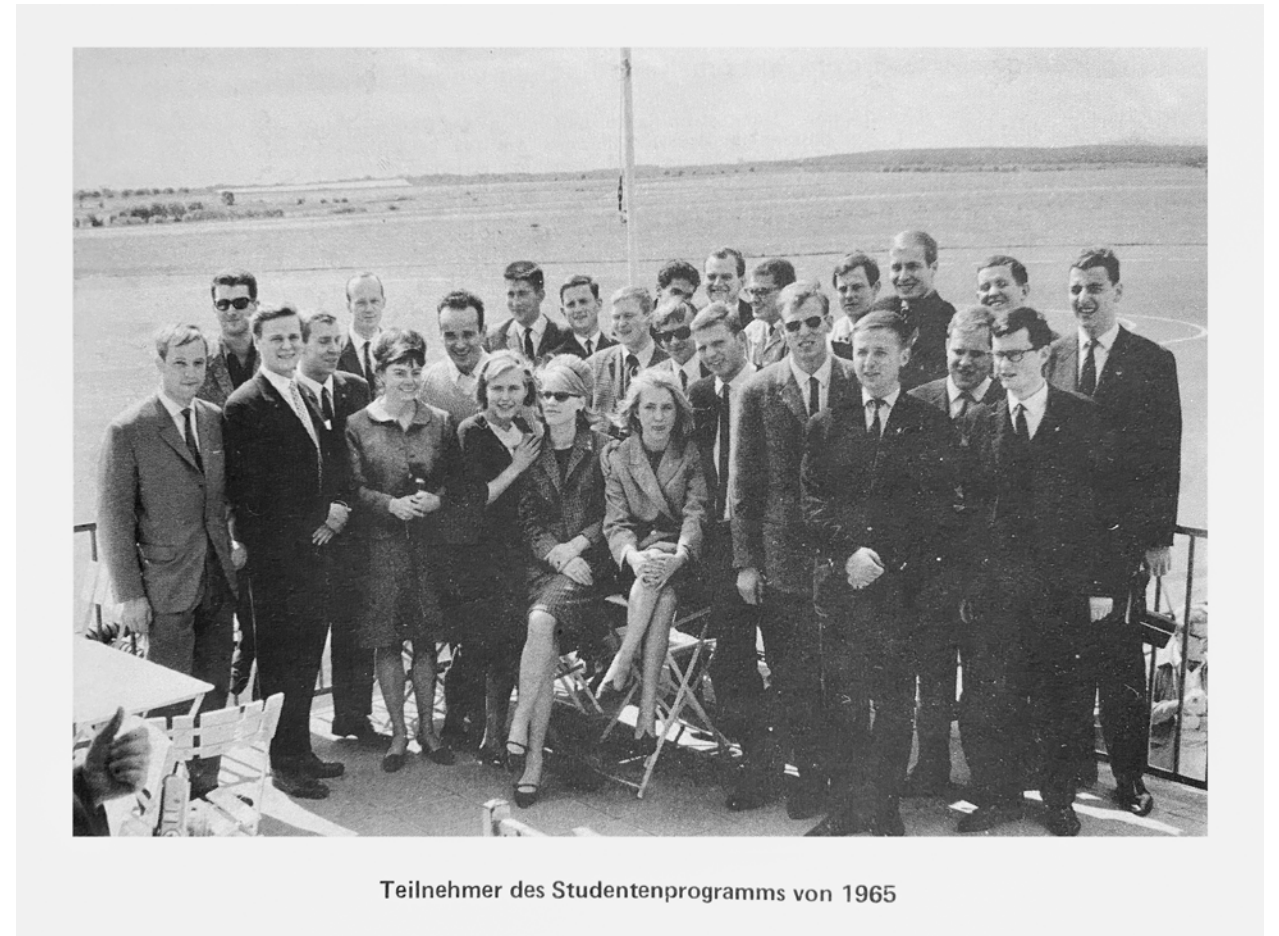
Teilnehmer des Studentenprogramms von 1965

Letztlich führten diese persönlichen Beziehungen und auch ein wenig Glück zum Erfolg. Die damalige DKG-Präsidentin Dorothea „Theanolte“ Bähnisch schaffte es auf Grund ihrer guten Beziehungen, die sie als Staatssekretärin des Landes Niedersachsen zur Bundesregierung aufgebaut hatte, dem damaligen Bundeskanzler Ludwig Erhard einen Spickzettel mit der Aufschrift „Studentenaustausch mit Kanada“ für seinen Staatsbesuch im Juni 1964 beim kanadischen Premierminister Lester Pearson zuzuspielen. Als die beiden Staatsmänner bei der abschließenden Pressekonferenz nach konkreten Ergebnissen des Besuchs gefragt wurden, griff Erhard routinemäßig in seine Jackettasche, fand dort den Spickzettel und