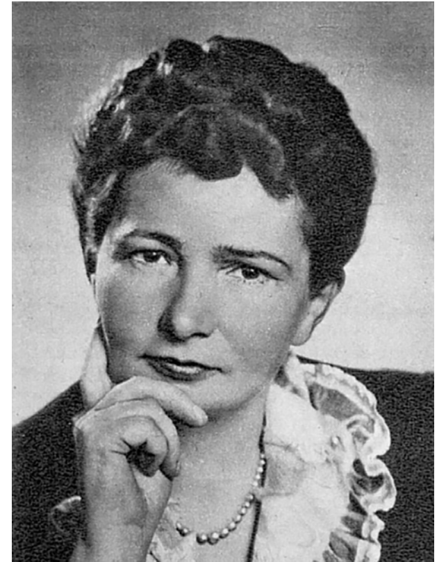
Portrait von Theanolte Baenisch, die 1964 Präsidentin der DKG war

(gs) Zu Beginn der 1950er Jahre waren in Deutschland die Wunden des 2. Weltkriegs noch sehr schmerzlich spürbar. Im Vordergrund standen die Sicherung des täglichen Lebensunterhalts und der Wiederaufbau der im Krieg zerstörten Städte und Dörfer. Der Weg zurück in die internationale Staatengemeinschaft war noch sehr weit weg.