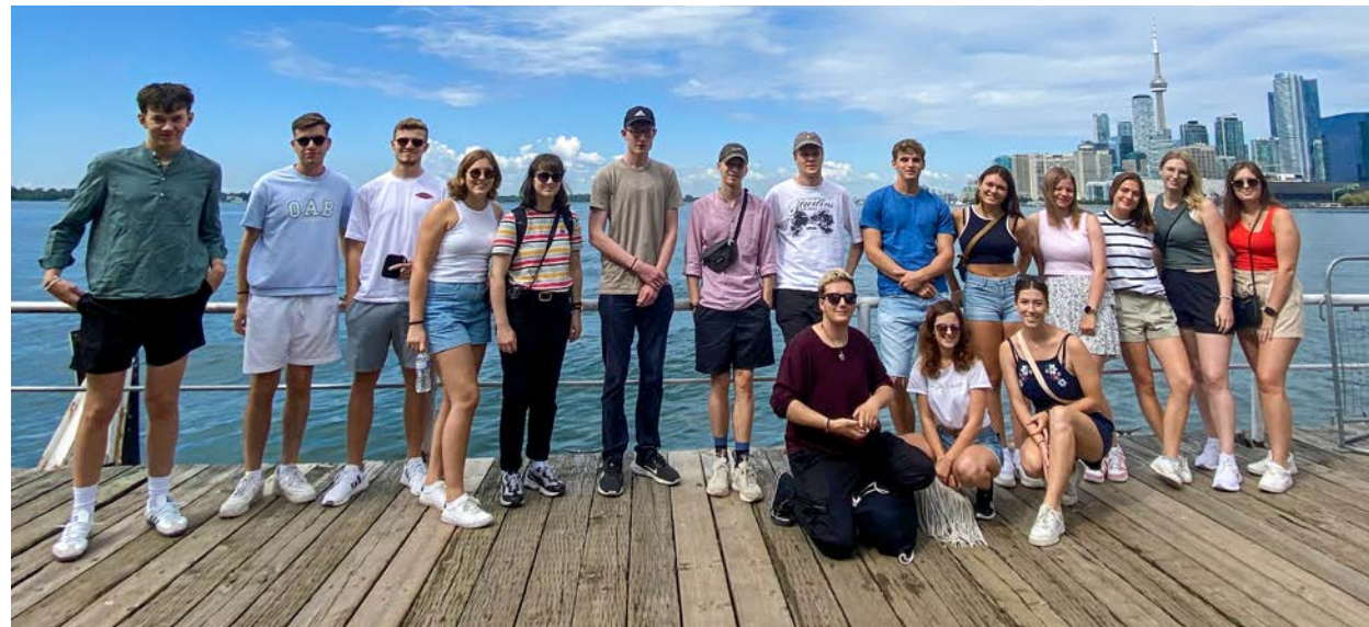
Teilnehmer am Work & Travel Programm vor der Skyline von Toronto

Seit sechs Jahrzehnten ermöglicht die Deutsch-Kanadische Gesellschaft (DKG) jungen Menschen, den „Ahorntaum“ nicht nur zu träumen, sondern zu arbeiten. Was 1965 als visionäres Werkstudienprogramm (WSP) begann, steht heute mit bereits weit mehr als 3.200 Teilnehmenden als Work & Travel Programm vor einer strategischen Neuausrichtung. Ein Blick auf die Geschichte, die DNA des Programms und die Pläne für die Zukunft.