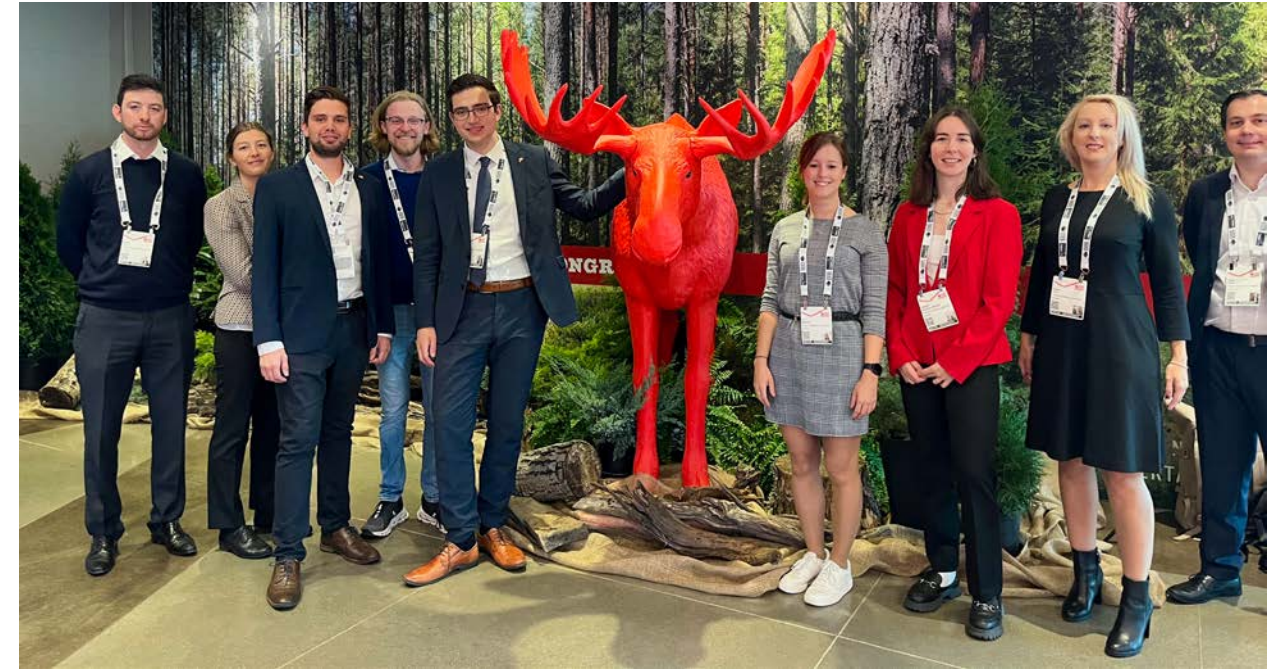
YTL 23 auf dem World Petroleum Congress in Calgary

Das YTL-Programm hat sich zum Ziel gesetzt, eine Plattform zum Lernen, Austausch von Erfahrungen und Ausbauen des persönlichen und beruflichen Netzwerks innerhalb der DKG zu bieten. YTL steht für „Young“, „Transatlantic“ und „Leadership“. Aspekte, die bei allen Studienreisen präsent sind und aktiv gelebt werden.